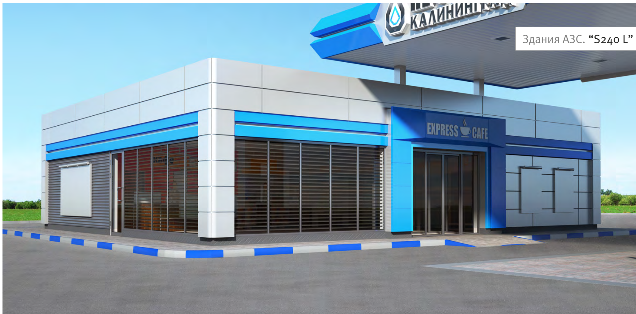
Здания АЗС. "S240 L"